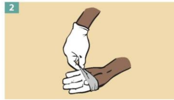
2 Peel the glove away from your body, pulling it inside out.