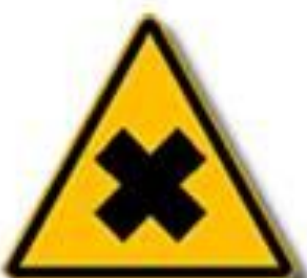
Sostanza nocive o irritanti