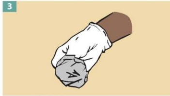
3 Hold the glove you just removed in your gloved hand.