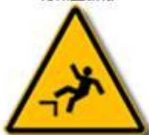
Caduta con dislivello