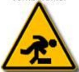
Pericolo di Inciampo