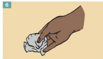
6 Dispose of the gloves safely. Do not reuse the gloves.