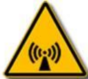
Radiazioni non ionizzanti