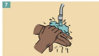
7 Clean your hands immediately after removing gloves.