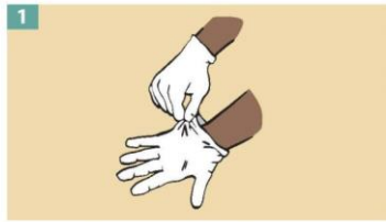
1 Grasp the outside of one glove at the wrist. Do not touch your bare skin.