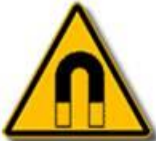
Campo magnetico intenso