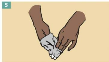
5 Turn the second glove inside out while pulling it away from your body, leaving the first glove inside the second.